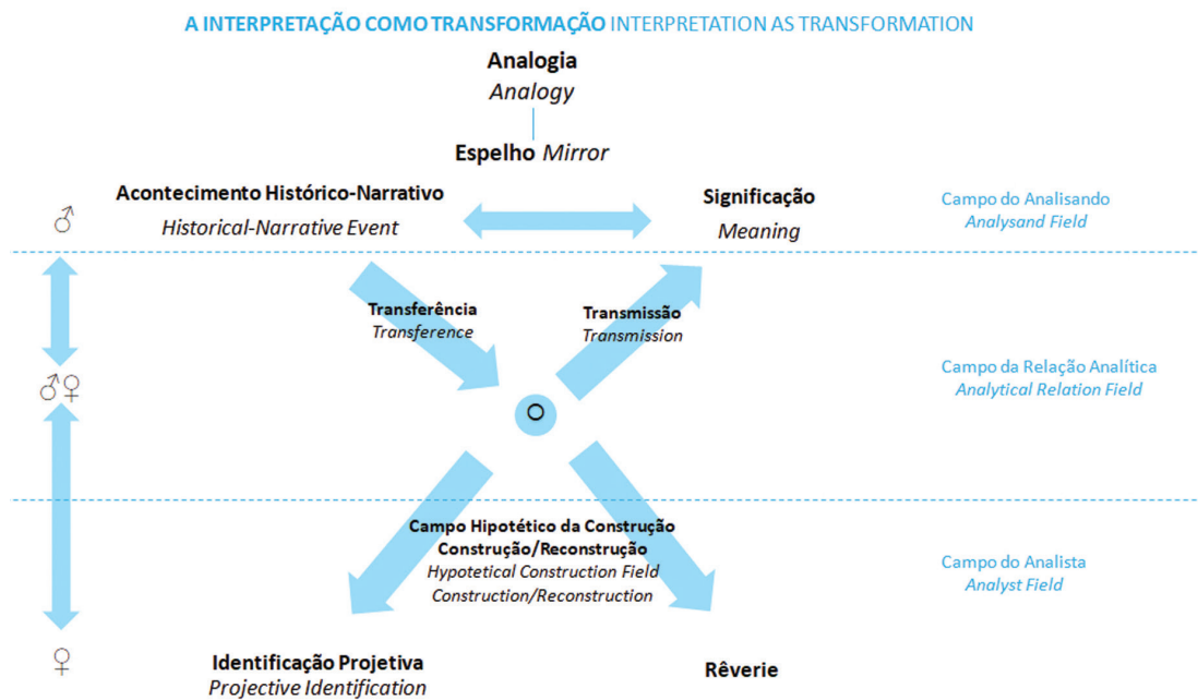
Figura 2 – Modelo proposto por Amaral dias para esquematizar a interpretação como transformação

Amaral Dias concetualiza assim um espaço potencial na mente do analista, que aproxima do conceito Winnicottiano, a que chama Campo Hipotético de Construção, que é constituído em primeiro lugar pela análise do analista, em segundo pelos modelos e teorias que o analista tem sobre o que é a psicanálise (contratransferência a priori) e em terceiro pela própria ideologia do que é a psicanálise. Este campo é hipotético no sentido em que gera as hipóteses de trabalho que vão surgir durante todo o processo analítico. Na sua visão a identificação projetiva, porque desvela o material oculto e a rêverie, porque o revela, são os meios de que o analista se serve para criar este campo hipotético de construção.