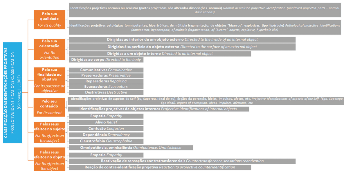
Figura 1 – Classificação das identificações projetivas segundo León Grinberg

Propõe também uma classificação das identificações projetivas quanto às suas qualidades, com diferentes tonalidades e intensidades, desde o mais saudável até ao mais patológico, conforme a Figura 1 abaixo.